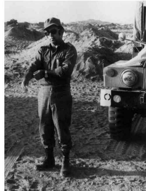
בסיני, מלחמת יום כיפור, 1973