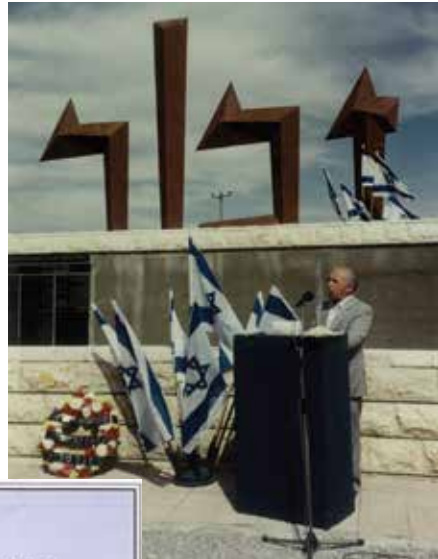
יד הזיכרון במבוא-מודיעין, יום השואה 1989