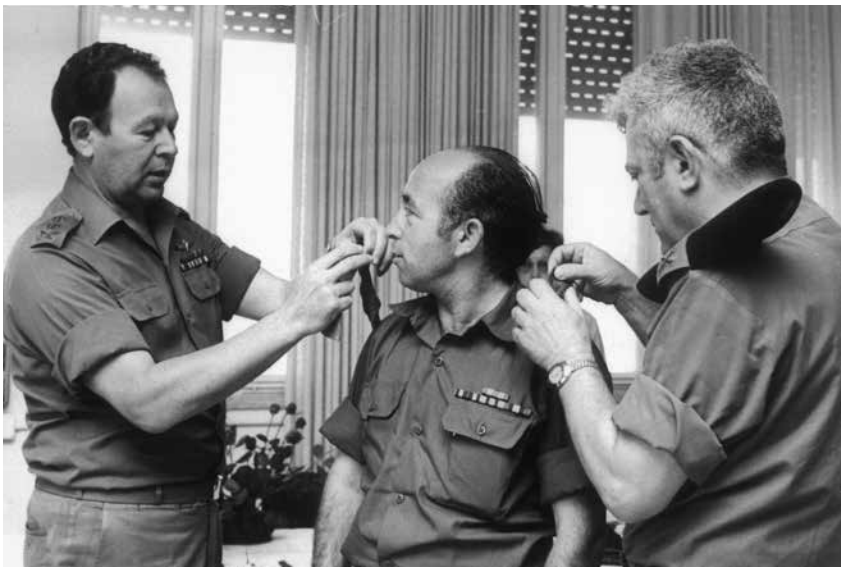
ענידת דרגות אל"מ על ידי הרמטכ"ל רא"ל מוטה גור וקצין תחזוקה ראשי תא"ל פיני להב, 1976