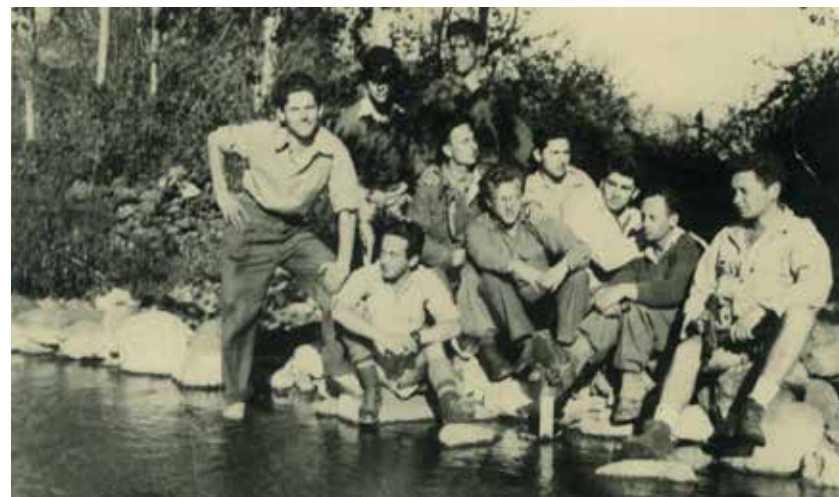
מעיינות הדן, מלחמת השחרור, 1948. אני יושב ראשון מצד שמאל