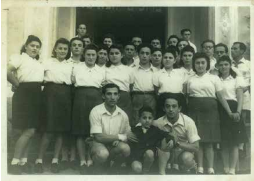
הקיבוץ בפרנוואלד, 6-1945. אני ראשון מימין בשורה הקדמית