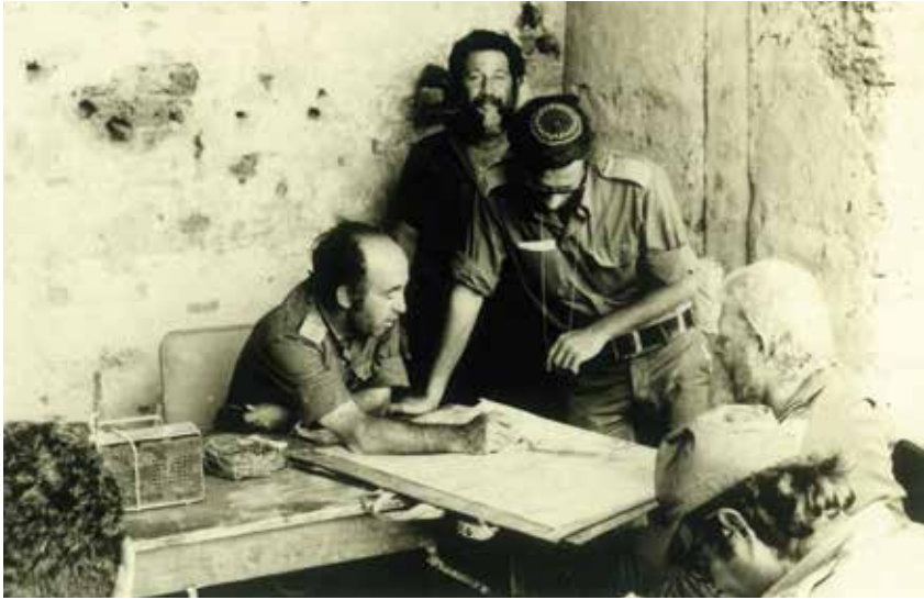
אחרי מלחמת יום כיפור, פברואר 1974