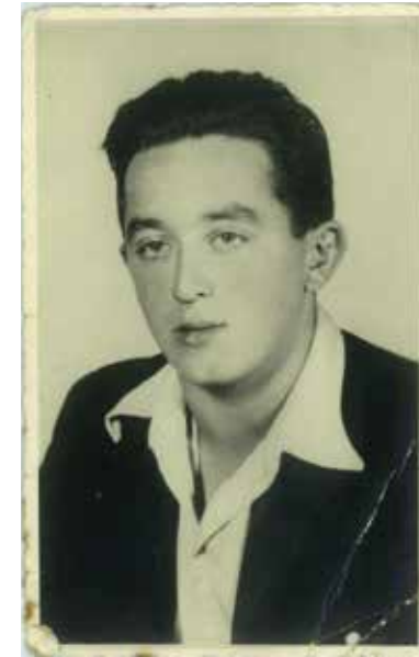
במחנה פרנוואלד, 1946