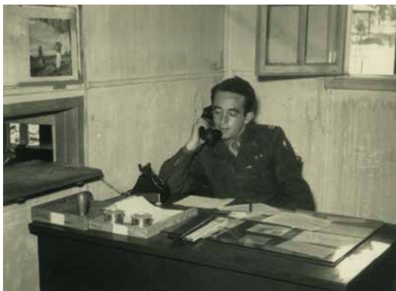
סגן בחיל הספקה, 1953