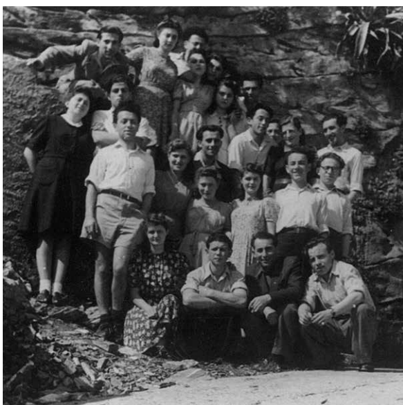
בוגליאסקו, איטליה, 1947. אני שלישי מימין בשורה השלישית