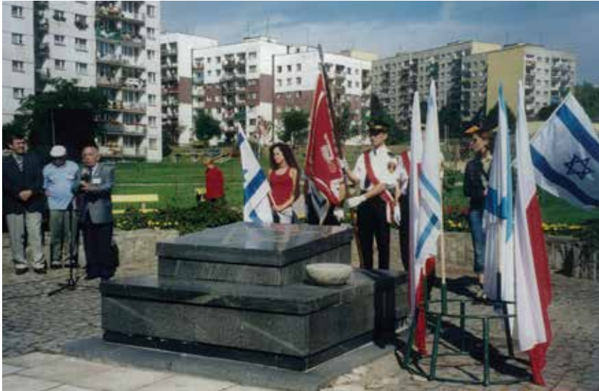
טקס בסוסנוביץ, 2003