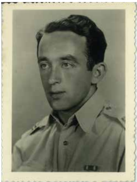
סגן בחיל הספקה, תחילת שנות ה-50