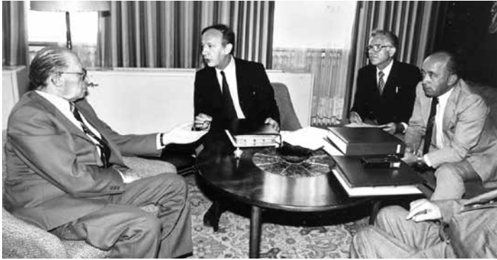
עם אריה בן-טוב ואיזי גרינגראס אצל רוח"מ מנחם בגין, 1981