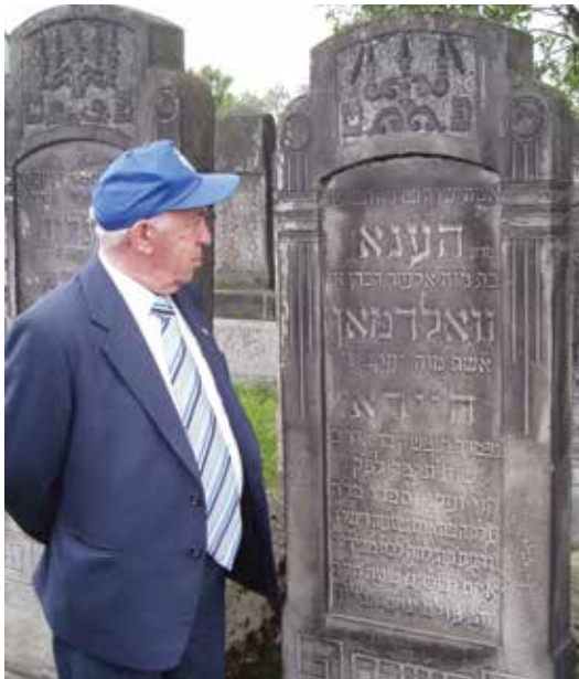
ליד קבר סבתי הנה היידה בבית הקברות בצ'לדז