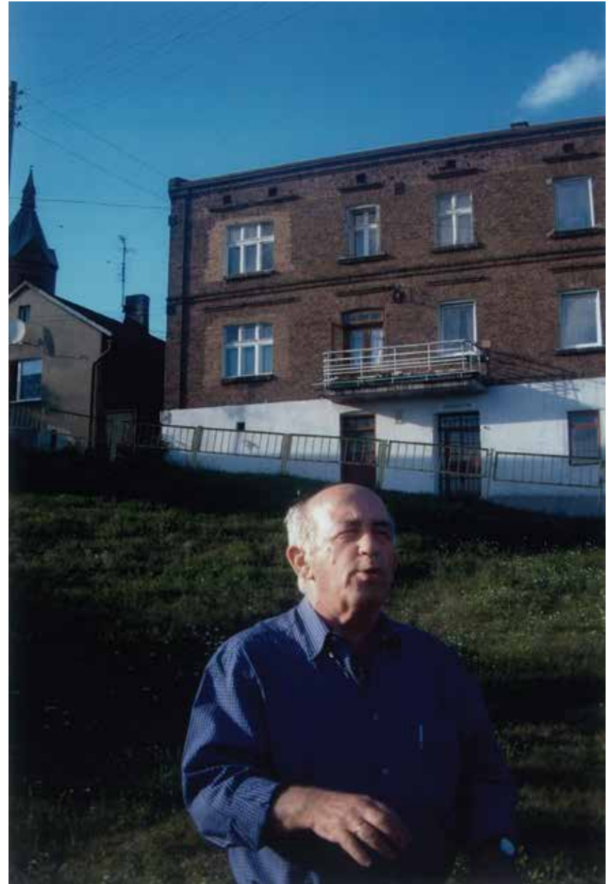
הבניין ברחוב מילוביצקה 8. החלון הגדול בקומה העליונה הוא חלון הדירה בה גרנו