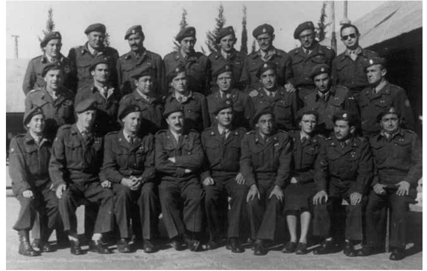
בקורס קציני הספקה, 1957. אני רביעי מימין בשורה הראשונה