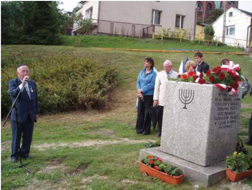
כאן עמד בית הכנסת בצ'לז. אזכרה ליד האנדרטה, 2006