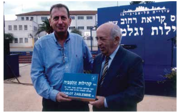
עם ראש העיר חולדאי בטקס קריאת רחוב קהילות זגלמביה בתל-אביב, 2002