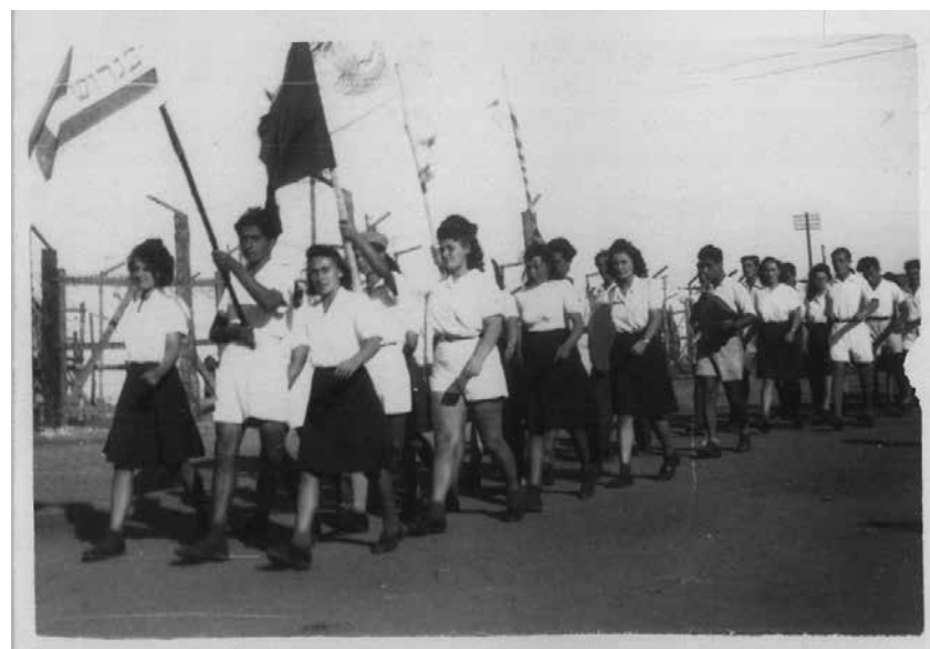
תהלוכה בקפריסין, 1947