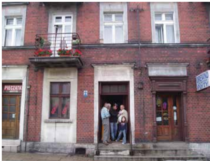
חזית הבניין ברחוב ביטומסקה 35, 2006