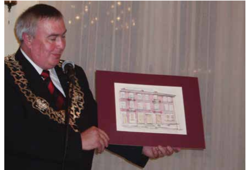
ראש עיריית צ'לדז אוחזו בציור של הבניין ברחוב ביטומסקה 35, טקס קבלת אזרחות כבוד, צ'לדז, 2006