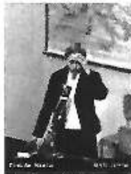
פרדקה מזיא על חוכן העדים במשפט אייכמן