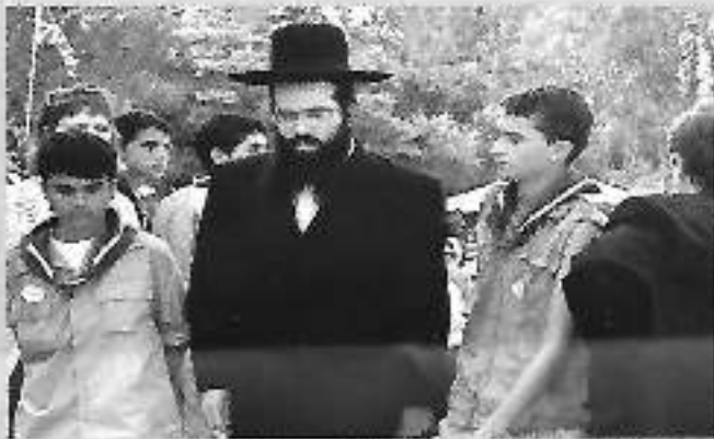
הרב הנח צבי רובינשטיין