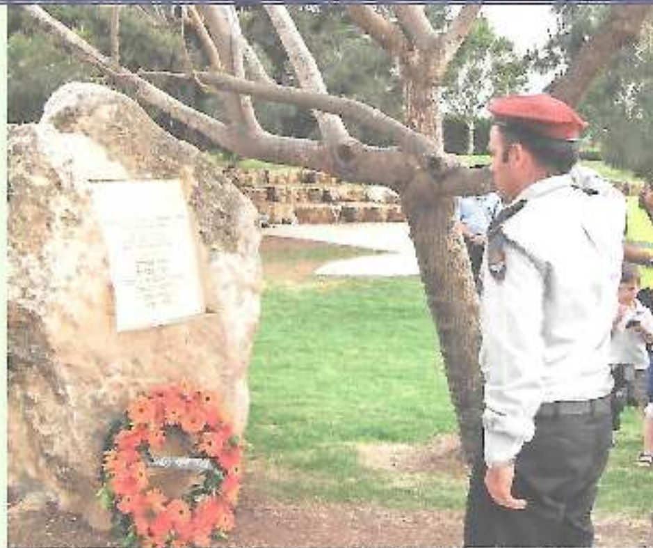
יום השואה תשע"א – אנדרטת נצר אחרון ביד הזיכרון לקדושי זגלמביה במודיעין Yom Hashoa Memorial service at Yad Hazikaron in Modiin - 2011

שנה טובה ומבורכת לכל בית ישראל Shanna Tova ! Happy New Year !