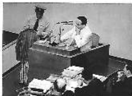
יחיאל די-נור (פיינר) על דוכן העדים במשפט אייכמן