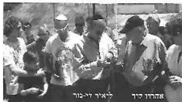
טקס הטמנת האפר ביסודות "בית ק.צטניק"