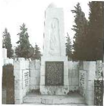
The monument for אנדרת אפר הקדושים בבית הקברות בחלת יצחק, ת"א Zaglëbie Martyrs at Nachalat Itzhak cemetery in Tel-Aviv

הידי וחברו אנשי זגלמביה, בעד מספר ימים יחגגו תושבי תל-אביב (עם עם ישראל כולו את שנת הגאון ליסודה של העיר תל-אביב.