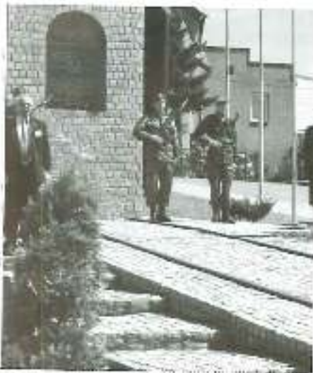
קייח תשס"ח, מסע שורשים של יוצאי זגלמביה בפולין Heritage tour to Zagłębie - 2008