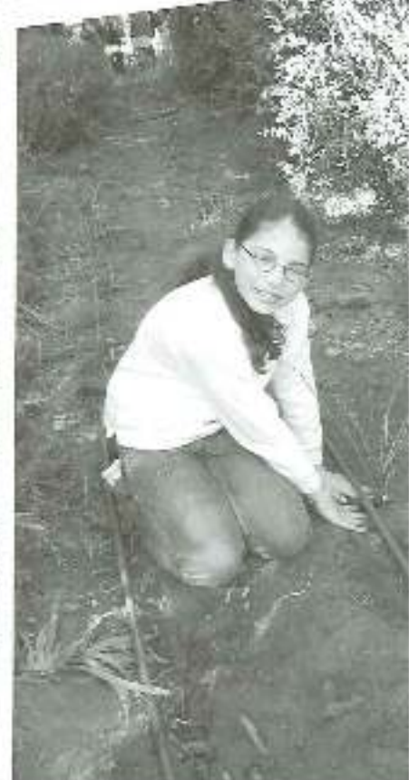
Tu Be'Shevat planting at Yad Hazikaron in Modiin, February 2009