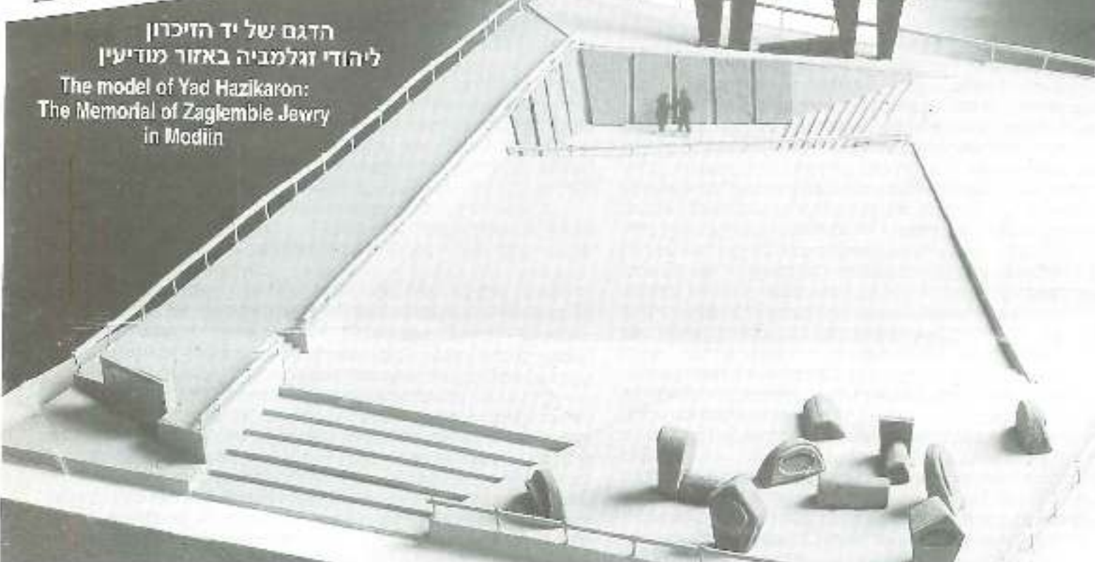
הדגם של יד הזיכרון ליהודי זגלמביה באזור מודיעין The model of Yad Hazikaron: The Memorial of Zagłębie Jewry in Modiin

ארגון יוצאי זגלמביה. רח' פרישמן 23 ת"א 63561, ישראל. טל: 03-5270919